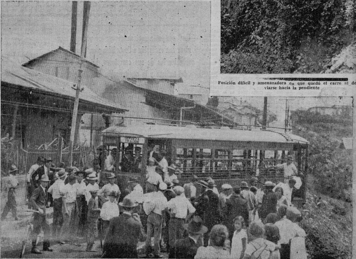
Los pasajeros y el público en movimiento al contenerse el descarrilamiento que puso en peligro muchas vidas